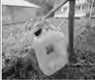
पानीको पासोमा फेरोमोनको प्रयोग