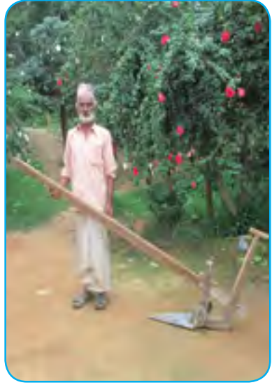
सुधारिएको फलामे हलो (Improved Metallic Plough)