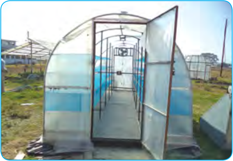
सोलार टनेल ड्रायर (Solar Tunnel Dryer)