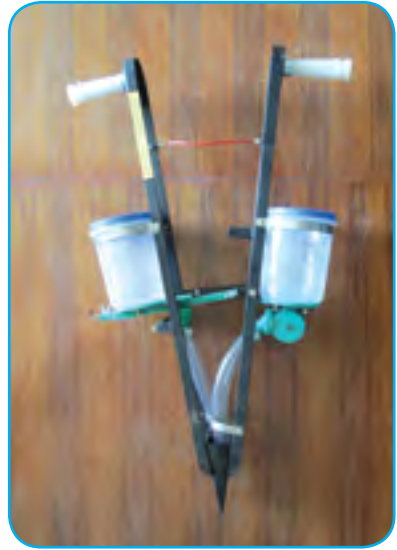
मकै रोप्ने (Jab Seeder)