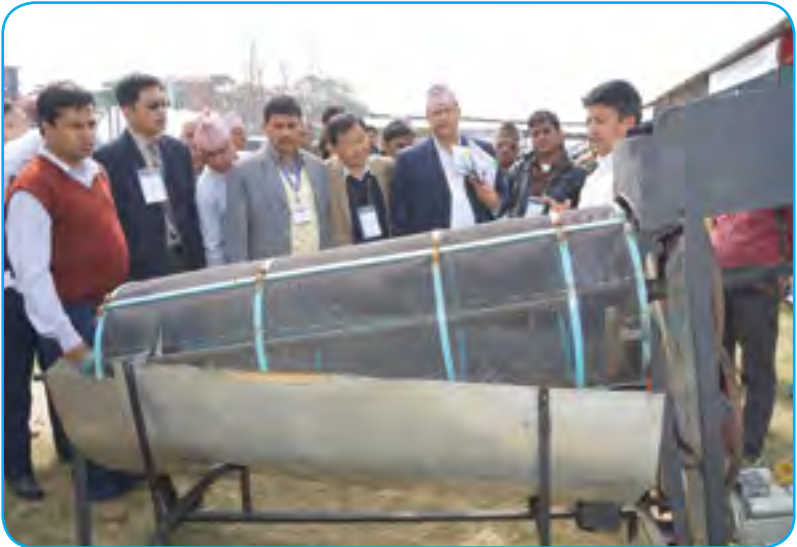
अदुवा सफा गर्ने (Ginger Washer)