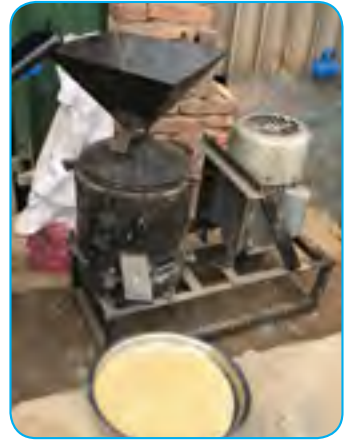
चिनो कटक (Proso millet dehusing machine)