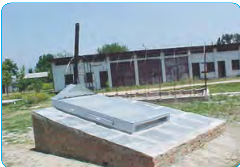
सरल थ्याप्चो सोलार ड्रायर (Simple Thyapcho Solar Dryer)