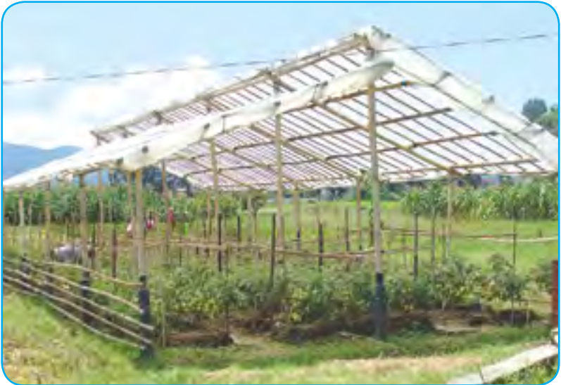
सुधारीएको प्लास्टिक घर (Improved Plastic House)