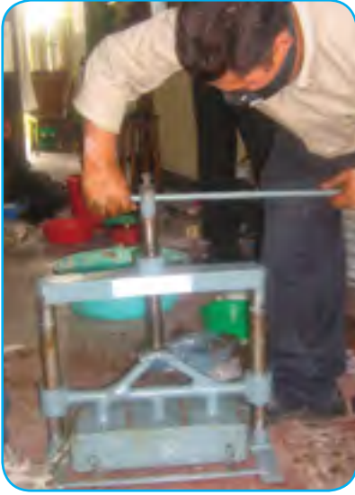
युरिया मोलासिस मिनेर्ल ब्लक (Urea Molasses Mineral Block)