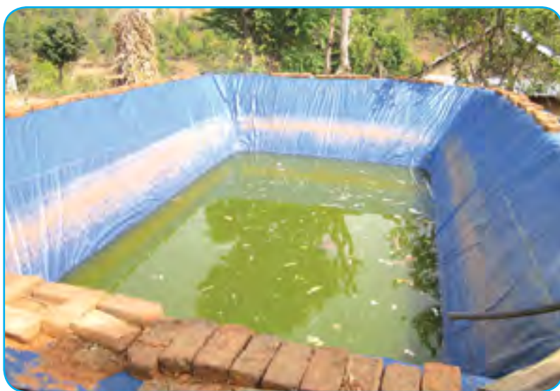
प्लास्टिक पोखरी (Plastic Pond)