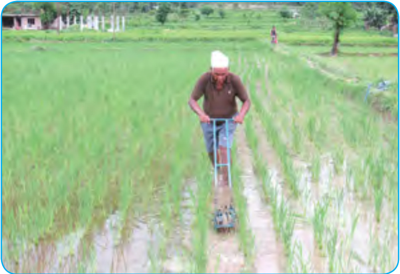
धानको भार गोड्ने (Paddy Weeder)