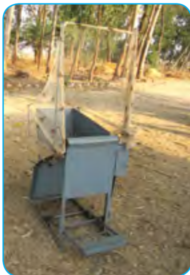
धान र गहुँ चुट्ने थ्रेसर (Rice and Wheat Thresher)