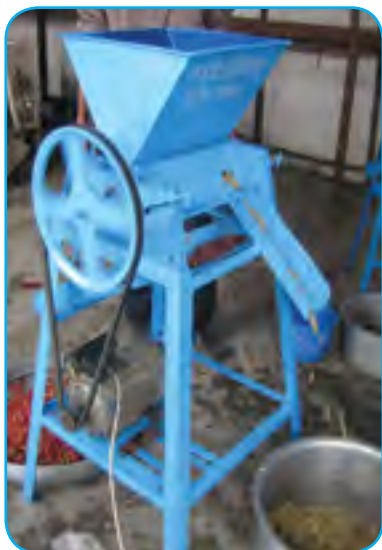
ए.ई.डि. कफि पल्पर (A.E.D. Coffee Pulper)