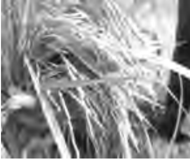
हर्दिनाथ हाईब्रीड धान १

धान नेपालको प्रमुख खाद्यान्न बाली हो र यसले देशको खाद्य सुरक्षामा ठूलो योगदान पुर्याएको छ । प्रमुख बाली हुदाँ हुँदै पनि हामी अझै पनि धानमा आत्म निर्भर वन्न सकेका छैनौ र देशमा चामल आपूर्तिको लागि ठूलो मात्रामा विदेशबाट आयात गर्न परिरहेको अवस्था छ । नेपालको उद्योग मन्त्रालायलको आँकडा अनुसार गत बर्ष हामीले लगभग ३२ अर्ब रुपैयाँ बराबरको चामल अयात गरेको थियौं । अहिलेको प्रतिस्पर्धात्मक अन्तराष्ट्रिय बजारमा हाम्रो धानलाई प्रतिस्पर्धी बनाउन उपलब्ध उच्च स्तरका नवीनतम प्रविधिहरू प्रयोग नगर्नुको कुनै विकल्प छैन किन भने दिनानुदिन उपलब्ध श्रोत साधनहरू घट्टदै गईरहेको अवस्था छ । यस वर्ष धानको कुल उत्पादन ५५.५ लाख टन रहेको छ । नेपालमा बाषिर्क प्रति ब्यक्ति चामलको खपत १३८ केजी रहेको छ । नेपालमा वार्षिक धानको आवश्यकता ६१ लाख टन रहेको छ । नेपालमा हाल ४७.६ लाख टन चामल चाहिन्छ । जबकि ३२.५ लाख टन मात्र उत्पादन भईरहेको छ । नेपालले आत्मनिर्भर हुनको लागि लगभग १५.१ लाख टन चामल बढि उत्पादन गर्नुपर्छ । जुन हाईब्रीड धानका जातहरूको खेति बाट मात्र सम्भव छ । हाल सालै नेपाल कृषि अनुसंधान परिषद अन्तर्गत राष्ट्रिय धानबाली अनुसन्धान कार्यक्रम हर्दिनाथले हाईब्रीड धानका दुई वटा जात जस्तै हर्दिनाथ हाईब्रीड धान १ र हर्दिनाथ हाईब्रीड धान ३ खेतीको लागि सिफारिस गरेको छ । यी जातको खेतीबाट उत्पादनमा वृद्धि गर्न सकिन्छ ।