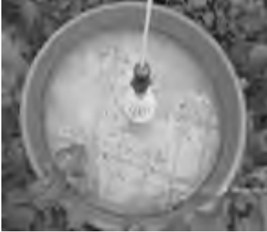
बत्तीको पासो तथा यसमा परेका पुतलीहरू