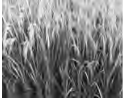
हर्दिनाथ हाईब्रीड धान ३