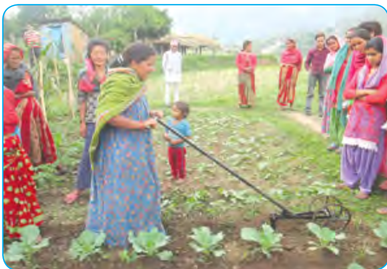
बारीको भार गोड्ने विडर (Dry Land Weeder)