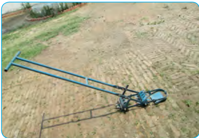
धानको भार गोड्ने (Paddy Weeder)