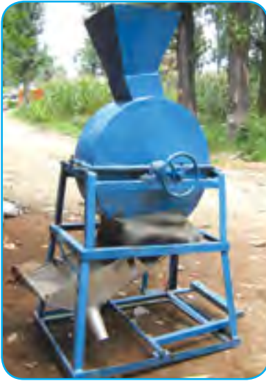
कोदो चुट्ने तथा फल्ने (Millet Thresher)